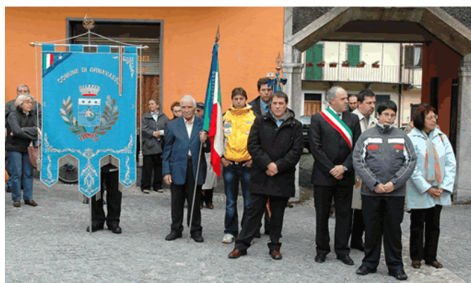
Nella foto di Angelo Rossi un momento delle celebrazioni del 25 Aprile che si sono tenute a Migliandone e Ornavasso

Sagre enogastronomiche della provincia del Verbano Cusio Ossola, che porterà nei nostri cortili alcune delle migliori manifestazioni del territorio, con i loro prodotti, costumi e folclore. Ci auguriamo che l'impegno organizzativo, la disponibilità delle associazioni locali e la cordialità di voi tutti ed in particolare dei proprietari dei 40 cortili coinvolti, sia gratificata dal bel tempo. La pioggia ha rallentato alcuni lavori previsti per il mese di Aprile, che slitteranno pertanto nel mese di Maggio e che interesseranno in