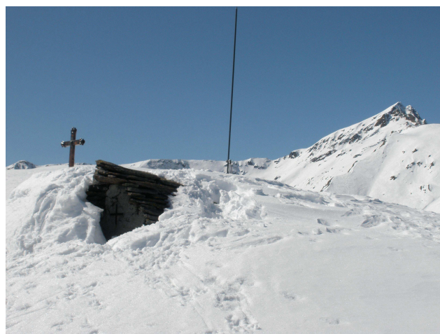
Ricordate la fotografia della Cappelletta del Buon Pastore dello scorso mese? Ecco un "aggiornamento" scattato il 15 marzo dal sig. Guido Merio che ringraziamo.

Senza proclami ma in modo concreto il comune di Ornavasso nel corso del 2008 e in questi primi mesi del 2009 ha incrementato le iniziative a sostegno delle fasce deboli e dei redditi più bassi dei propri cittadini. Non assistenzialismo ma opportunità di lavoro per soggetti in difficoltà e soprattutto più informazione circa i contributi stanziati per le famiglie ed i pensionati dalla Regione Piemonte e dal Governo. Spesso le amministrazioni comunali devono fare i salti mortali per stanziare pochi contributi a sostegno delle fasce deboli, mentre rimangono inutilizzate altre risorse già stanziati per lo stesso scopo. I principali ostacoli sono la burocrazia e la difficoltà di accedere alle informazioni o reperire i moduli per le domande. Vi assicuro che non è impresa facile neppure per il sottoscritto comprendere certi meccanismi burocratici. Eppure attraverso lo sportello famiglie abbiamo aiutato molti cittadini a superare questo ostacolo e nei mesi di febbraio e marzo sono state inoltrate più di 80 richieste per i bonus famiglia ed elettricità. E' cresciuto anche il numero di bonus affitti