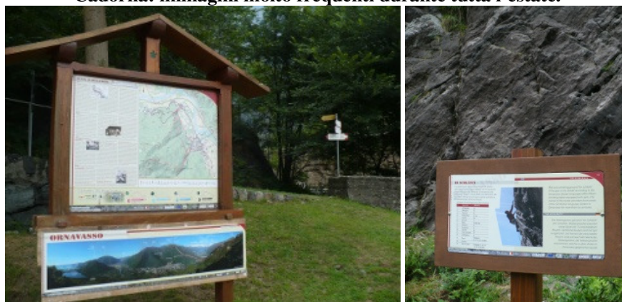
Il sistema di valorizzazione dei percorsi mediante pannelli e bacheche informative realizzati nella primavera e posizionati durante l'estate ha favorito la presenza di turisti italiani e stranieri. I tracciati, i sentieri di accesso e le trincee sono stati oggetto di ripetuti interventi di pulizia e manutenzione.