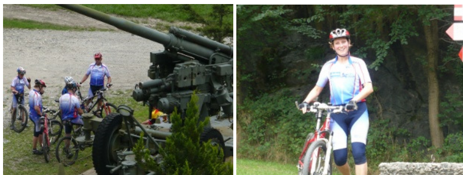
Turisti stranieri in mountain-bike nel piazzale di accesso e lungo la Linea Cadorna: immagini molto frequenti durante tutta l'estate.

campeggi e dalle strutture del Lago Maggiore, che hanno scelto l'area storico-archeologica naturalistica di Ornavasso e Migiandone e le montagne per il trekking, il nordick walking, la mountain bike, con visite al Santuario del Boden e al sistema difensivo della Linea Cadorna. La prossima apertura continuativa alle visite dell'Antica Cava consentirà un ulteriore lancio del nostro paese come meta per un turismo attivo e culturale.